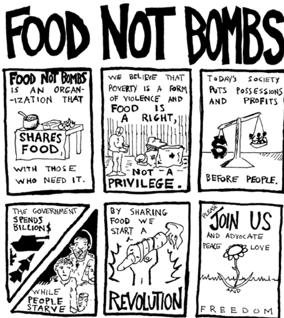
2. ábra: Food not bombs mozgalom céljai