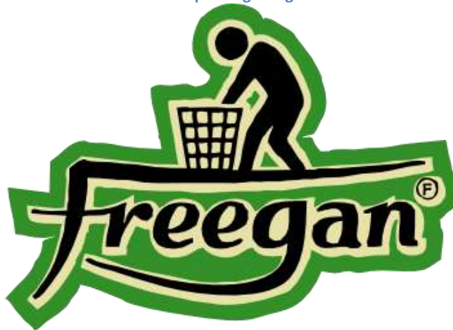
1. kép: Freegan logó

A jóléti társadalom pazarlása ellen önkéntes munkanélküliséggel és csendes, életvitelszerű újrahasonítással tiltakozik. Nem, vagy nem feltétlenül kényszerből választja ezt az életformát, hanem egyfajta tiltakozásként a fogyasztói társadalom ellen. Számos angolszász nagyváros után már Közép-Európában is fellelhető ez az életforma. 14